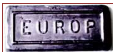
Le premier lingot de fonte européenne, marqué "Europ", voit le jour à Esch-sur-Alzette, au Luxembourg, le 30 avril 1953. Il est le symbole de la Communauté européenne du charbon et de l'acier, puisque la première coulée de fonte européenne a utilisé des matériaux de pays jusqu'alors ennemis. Remis à Jean Monnet le jour de la cérémonie, il est conservé à la Fondation Jean Monnet pour l'Europe.