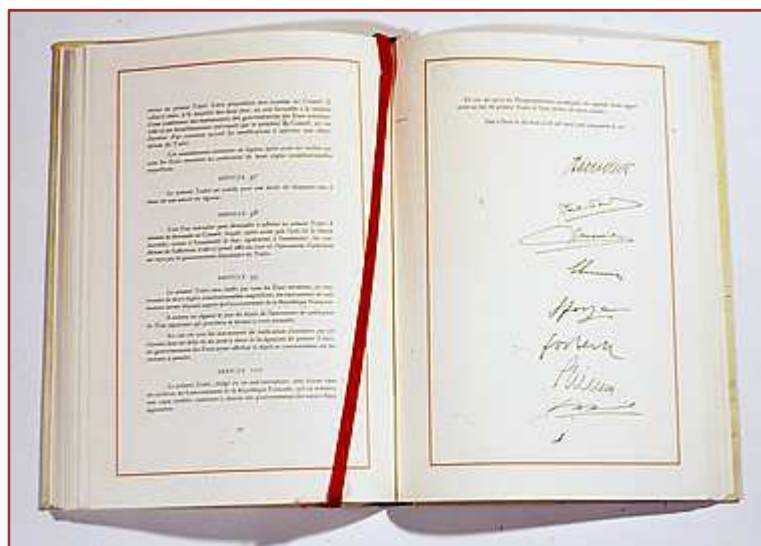
Traité signé à Paris le 18 avril 1951 instituant la Communauté européenne du charbon et de l'acier.