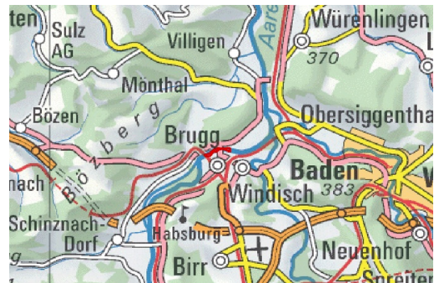
BLN 1018 Aareschlucht in Brugg