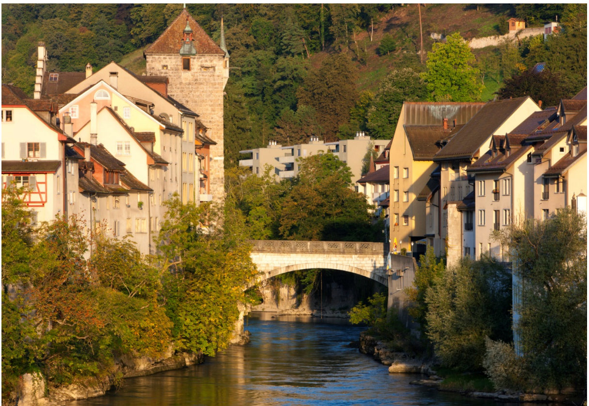
Aareschlucht mit Altstadt von Brugg, Steinbrücke und Schwarzem Turm