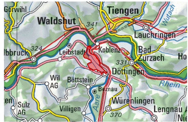
BLN 1109 Aarelandschaft bei Klingnau