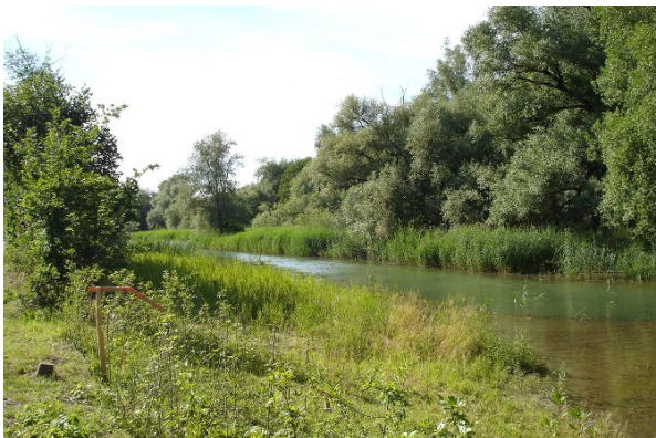
Ufervegetation: Brutorte zahlreicher Wasservögel