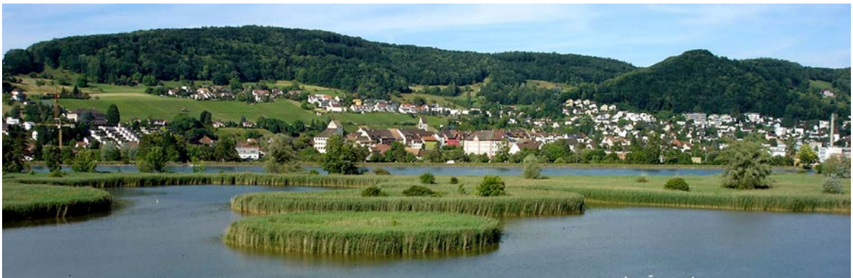
Klingnauer Stausee, Klingnau im Hintergrund