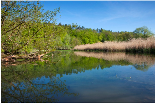
Auenlandschaft im Gippinger Grien