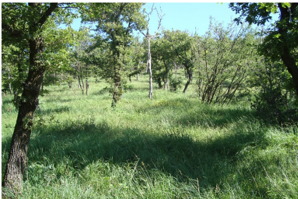
Prati secchi e boschi di quercia in località Forello