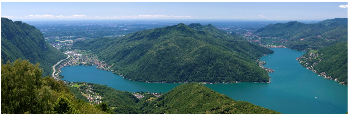
Il Monte San Giorgio tra i due rami meridionali del Lago di Lugano