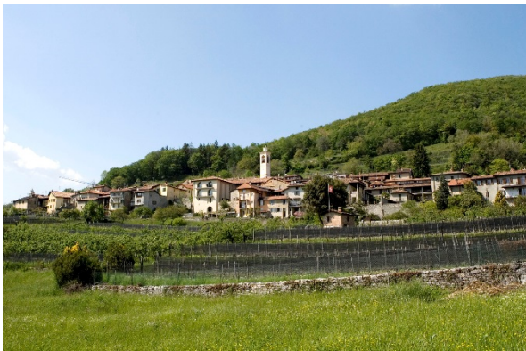
Il villaggio di Meride