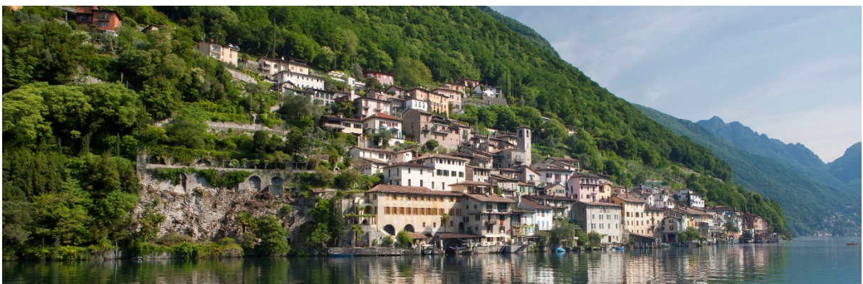
Il villaggio lacuale di Gandria