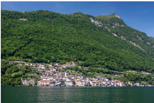
Gandria e il ripido pendio affacciato sul Lago di Lugano