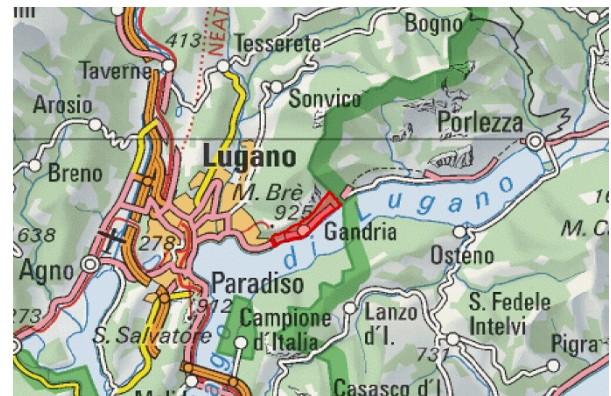
IFP 1812 Gandria e dintorni