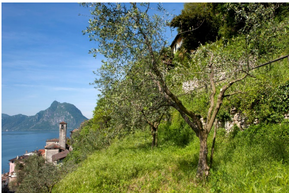
Uliveti terrazzati in località Piatta