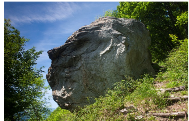
Sasso della Predescia