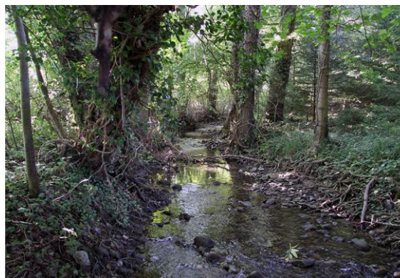
Ruisseau de Champagne