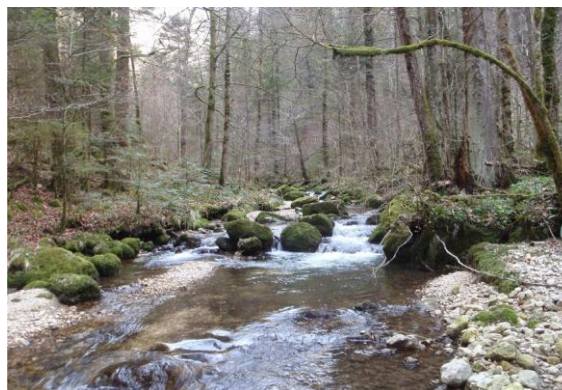
La Sorne près de Sornetan