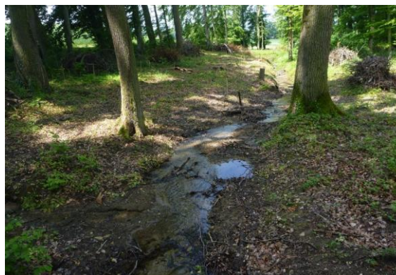
Ruisseau Prüs de Courgevaux FR