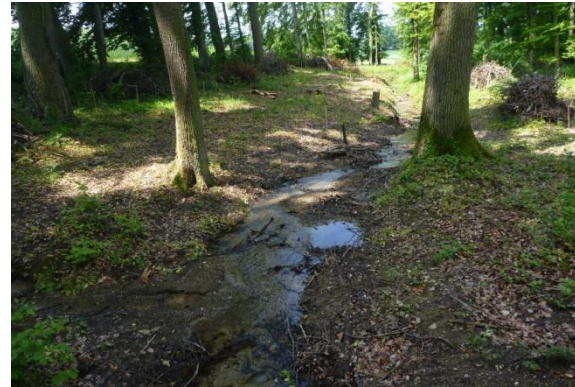
Bach bei Courgevaux FR