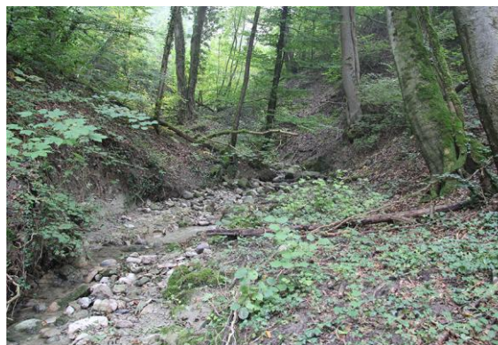
Ruisseau près du Villaret