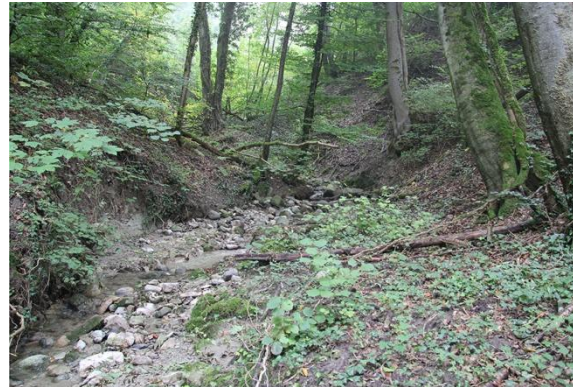
Bach bei Le Villaret