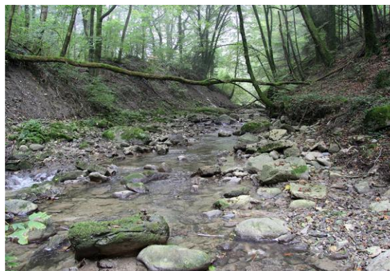
Le Buron près d'Essertines-sur-Yverdon