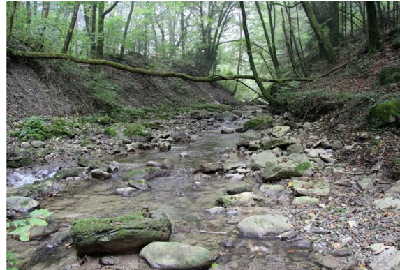
Buron bei Essertines-sur-Yverdon