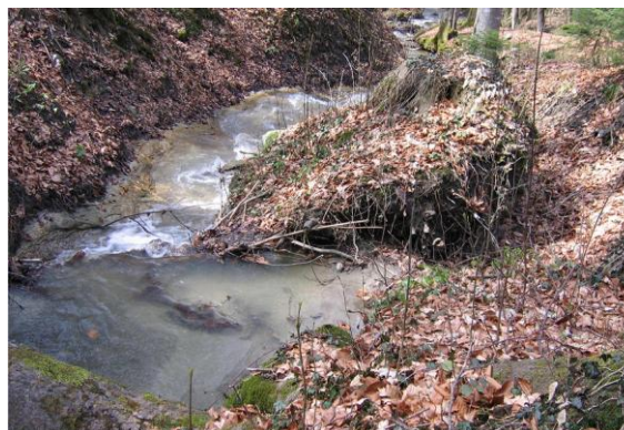
Ruisseau près de Grangettes