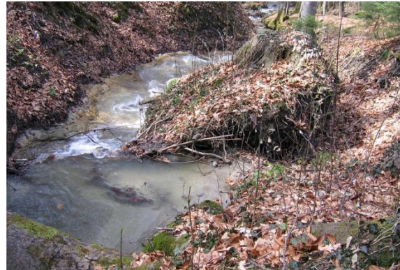
Ruisseau Grangettes