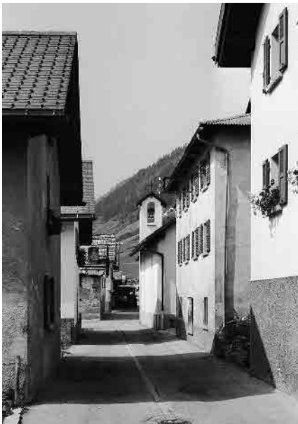
3 Via principale di attraversamento