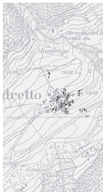
Direzione delle riprese, scala 1:8000 Fotografie 1988: 2, 3, 5, 10, 11 Fotografie 1998: 1, 4, 6-9