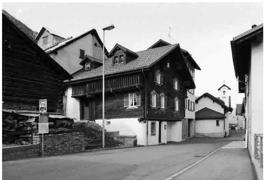
6 SS. Rocco e Sebastiano, sec. XVII, da ovest