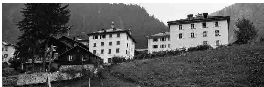
11 Edifici in sola muratura e edifici «a castello», vista da sud