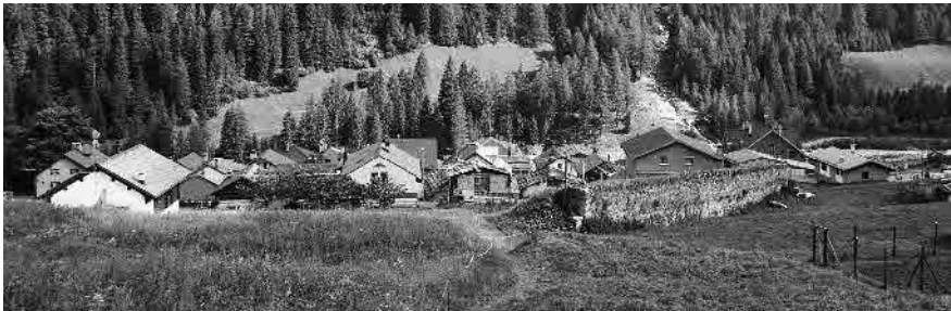
1 Vista da nord e da monte

Comune di Bedretto, distretto di Leventina, Cantone Ticino