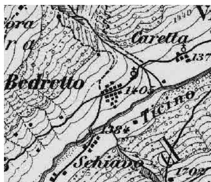
Carta Siegfried 1872

A 1400 metri d'altezza, in situazione storicamente strategica, in prossimità di passi per l'Italia, per il Vallese e per la Svizzera interna, popolato dall'emigrazione e dalle valanghe, rivitalizzato dalla strada per il passo della Novena. Grandi dimore ottocentesche in sola muratura accanto agli edifici in legno.