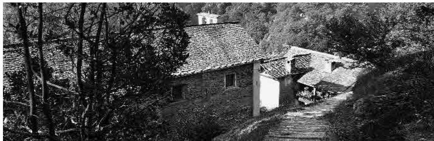
1 Lungo il sentiero per le Centovalli