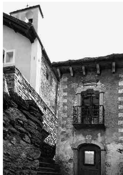
3 La «Colombera»