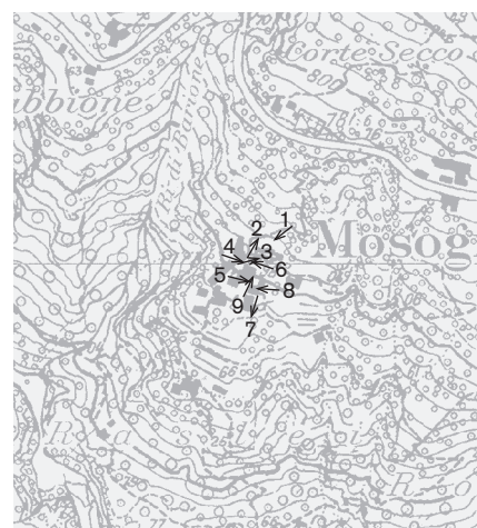
Direzione delle riprese, scala 1:8 000 Fotografie 2008: 1-9