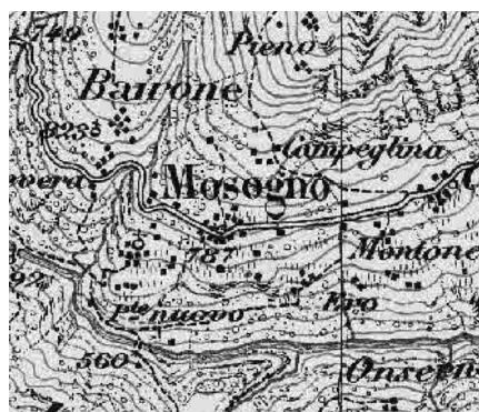
Carta Siegfried 1895

Nascosto a valle della strada cantonale e di Mosogno, il minuscolo insediamento si situa lungo un antico sentiero di collegamento con le Centovalli e, nonostante le dimensioni e il carattere rurale, presenta dimore con tratti di modesto prestigio, leggibili in logge, porticati e portali coronati di granito.