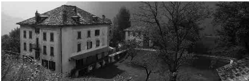
1 Dimora signorile con tratti del Liberty

Comune di Calpiogna, distretto di Leventina, Cantone Ticino