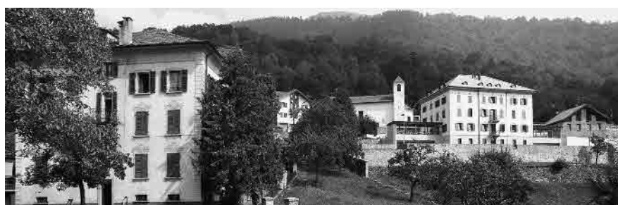
13 Panoramica da sud