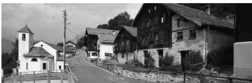
8 La strada di attraversamento