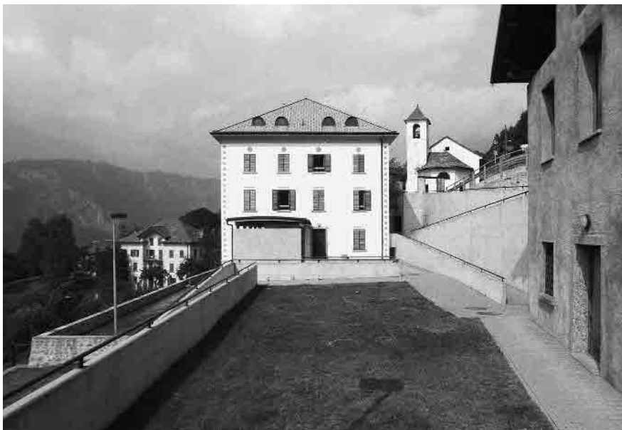
2 Casa Ida, struttura per disabili