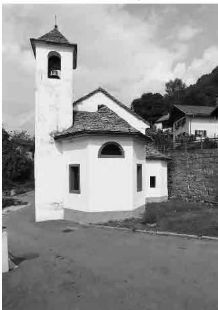
3 Cappella S. Antonio da Padova, 1651