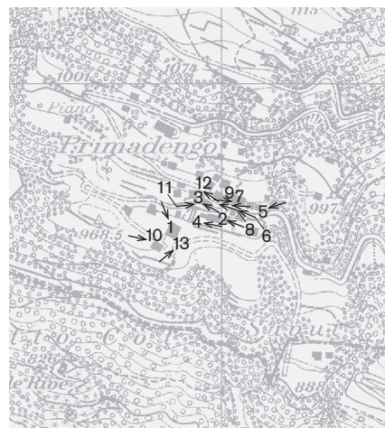
Direzioni delle riprese, scala 1:8000 Fotografie 1988: 2, 8, 11 Fotografie 1997: 1, 3 - 7, 9, 10, 12 - 15