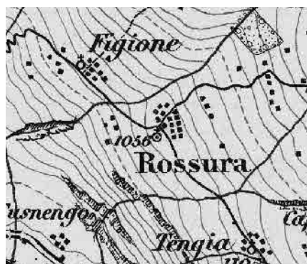
Carta Siegfried 1871

L'immagine del villaggio è legata alla decisa dominanza delle fronti in legno e delle coperture in piode che si confrontano a distanza con la parrocchiale, citata già nel secolo XII, posta su un rialzo del terreno. Il patrimonio edilizio di Rossura è un significativo campionario dell'edificazione tradizionale della regione.