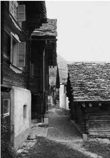
9 Percorso interno sul margine orientale