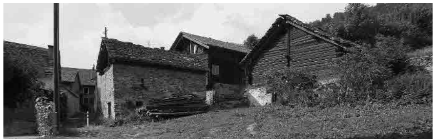
12 Stalla in muratura, rarità in Rossura