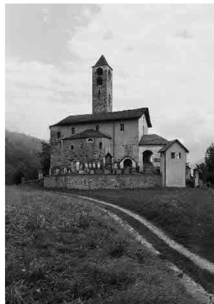
S. Lorenzo, attestata nel sec. XII