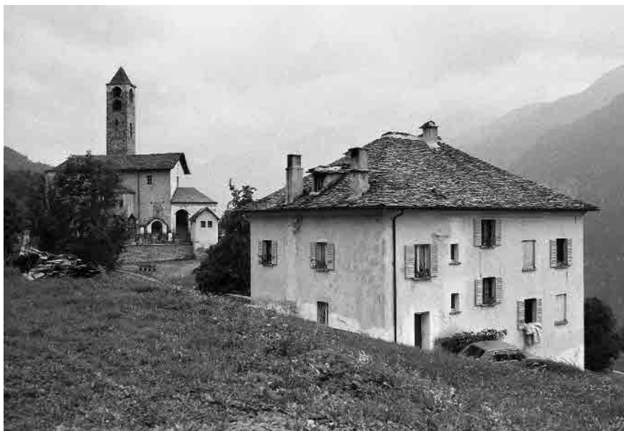
1 Ex canonica

Comune di Rossura, distretto di Leventina, Cantone Ticino