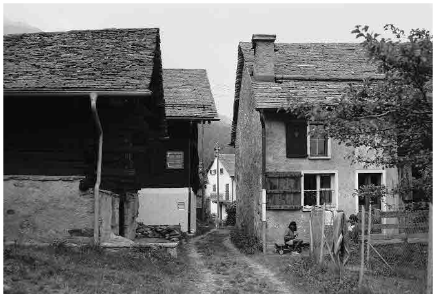
14 Margine nord orientale